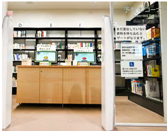
市民図書館 1階 新聞コーナーの近く