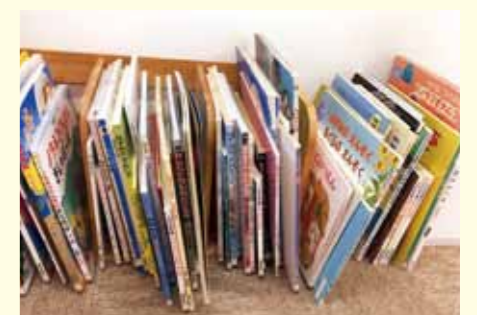
▲おはなしのへやの壁には多くの大型絵本が、名作を迫力あるサイズで楽しめます。