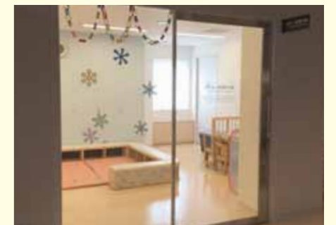
▲「子ども一時預かり室」はお子さまが安心して過ごせる施設です。おもちゃの用意もあります。